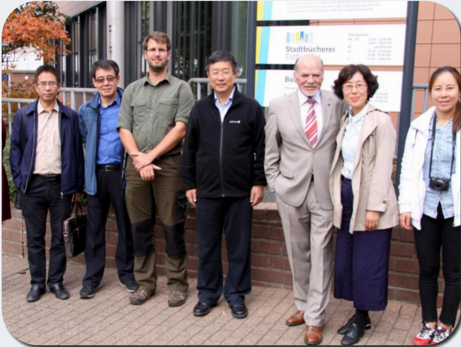
Eschweiler Zeitung/Eschweiler Nachrichten