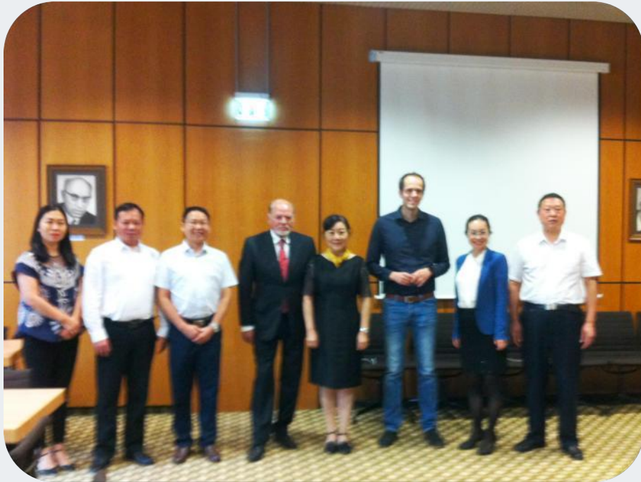
Die Delegation aus Yuetang