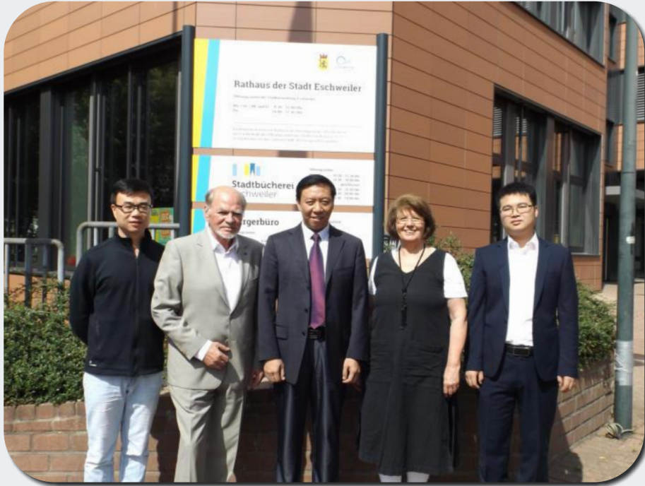
Die Delegation aus Shangrao