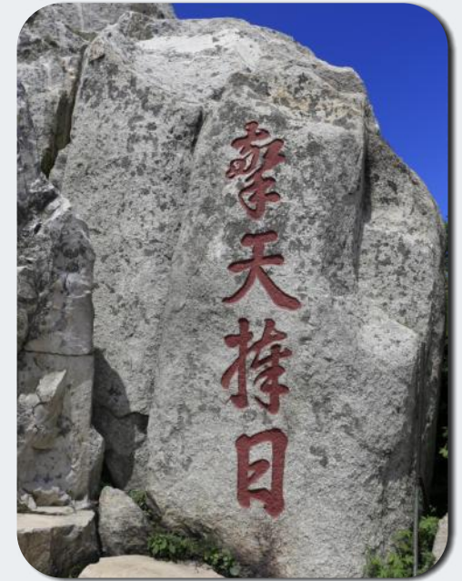
Impression Stadt - Land